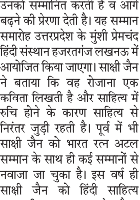
हरिभूमि न्यूज राजगढ़

सांरंगपुर। सांरंगपुर विकास खंड के अंतर्गत आने वाली ग्राम पंचायत आसारोटा परमार के ग्राम आसारोटा रावत के प्राथमिक विद्यालय भवन एवं छात्र छात्राओं का भगवान ही मालिक हैं, भगवान भरोसे स्कूल भवन खड़ा